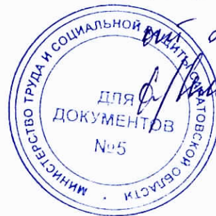
Рис. N 1185/24-Д